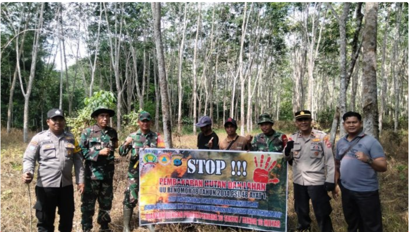
Personel Gabungan HST Lakukan Patroli dan Sosialisasi Cegah Karhutla

BARABAI-Masih maraknya hotspot dan dan terjadi kebakaran lahan, Aparat Gabungan TNI-Polri, BPBD HST, Manggala Agni, Relawan dan masyarakat melaksanakan patroli cegah karhutla.Selasa (22/08/2023).